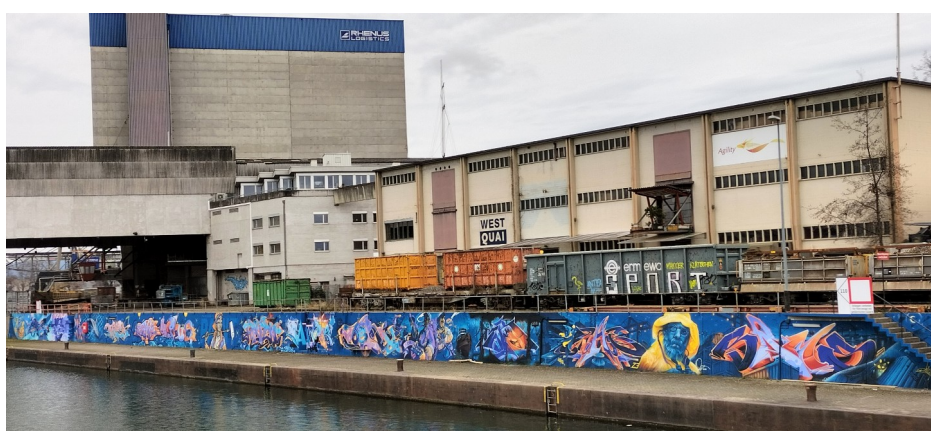
Visite du Port de Bâle – 10 mars 2024

Ils avaient imaginé un trajet sur le Rhin de Rotterdam à Bâle, en évoquant aussi bien l'activité commerciale rhénane, que les difficultés de circulation liées à l'abaissement du niveau du Rhin ou encore les divers atouts économiques et touristiques de Bâle et sa région transfrontalière. Vous pourrez lire leur carnet sur l'ENT.